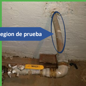
Ejemplo de region de prueba

No dude en enviar un correo electrónico a nuestros inspectores de Sunrise Engineering. Incluya la dirección de su casa y la pregunta con una foto de la región de prueba de su tubería de agua para: